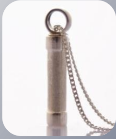
Design-Schmuck "Lina" auch ohne Pfote erhältlich 135,- €