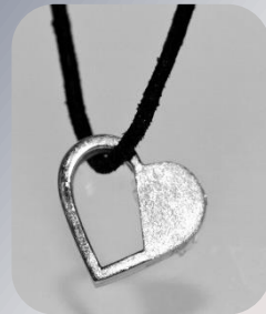
Design-Schmuck "Tira" 135,- €

Design-Schmuck aus 925er Silber. Für einen kleinen Teil Asche geeignet. Incl. Silberkette (ca. 42 cm) und Schmuckdose. Vorbestellung nötig.