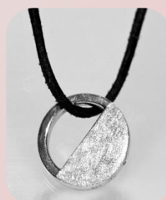
Design-Schmuck "Oria" 135,- €

Aus 925er Silber. Für einen kleinen Teil Asche geeignet. Incl. Lederkette (ca. 50 cm) und Schmuckdose. Vorbestellung nötig.