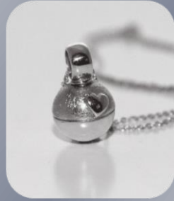
Design-Schmuck "Fini" mit Herz oder Pfote erhältlich 135,- €